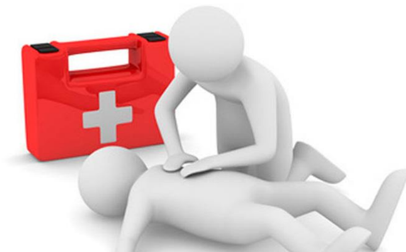
Figura 4 – Representação de um procedimento de primeiros socorros.

Nesta competição os alunos serão primeiramente treinados, onde haverá uma instrução teórica com a orientação prática de primeiros socorros, com ênfase em atendimento de parada cardiorrespiratória (PCR), de acordo com os protocolos internacionais de Reanimação Cardiopulmonar. A sequência dos atendimentos e as técnicas básicas serão ensinadas para todos.