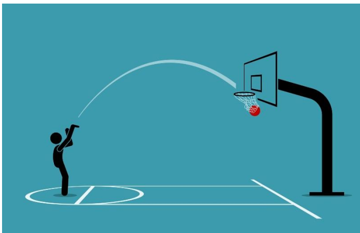
Figura 1 – Arremesso Livre